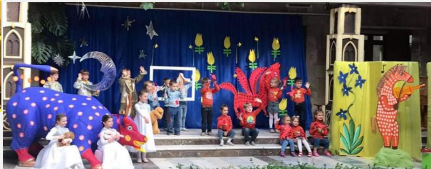
Мистецький проєкт «Казковий світ Марії Примаченко оживає на радість дітям» ЦРД «Лазурний» м.Запоріжжя